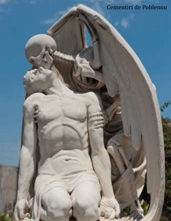
Cementiri de Poblenou