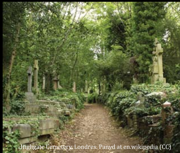
Highgate Cemetery, Londres.