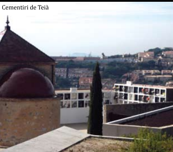
Cementiri de Teià