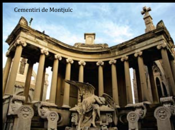
Cementiri de Montjuïc