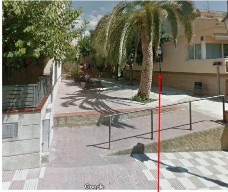
Lloc recomanat per posar la senyalització

No obstant, la Junta de Govern Local acordarà el més adient en dret.